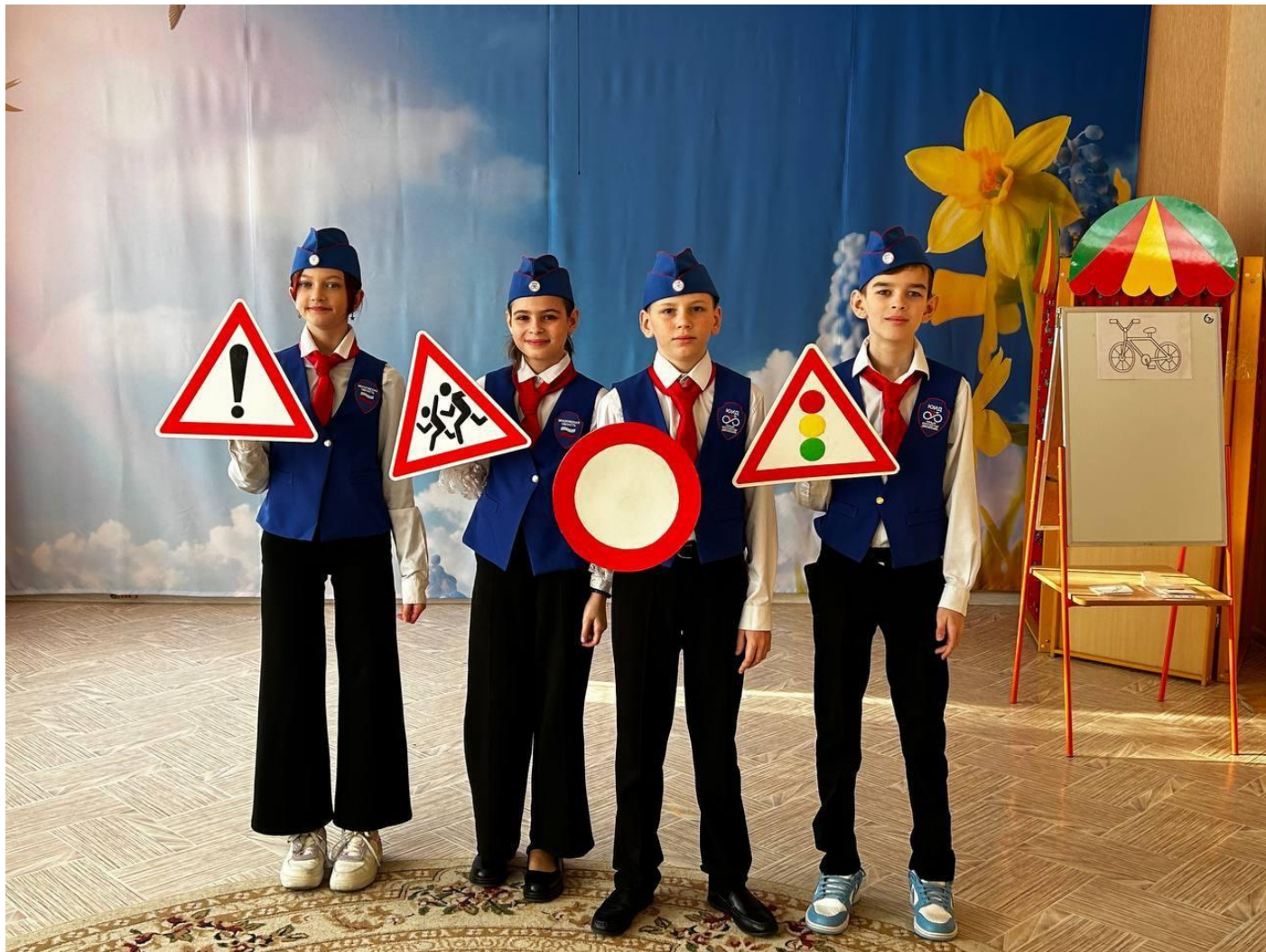
Отряд ЮИД «Зебрики» принял участие в ежегодном конкурсе агитброд «Безопасное колесо».